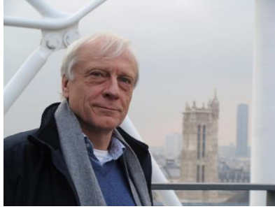
پروفیسور مارتین فاردین براونیسین

ناسنامهی کتیب: کورد و مارتین، نووسەر: مارتین فاردین براونیسین وه رگتیران له ئینگلیسییه وه: حه سه ن قازی، ئەکادیمیای کوردی، هه ولتیر ، ۲۰۱۷.