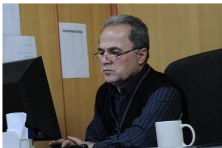
مه مه د كه ريم

خوښندهوويه ك بۆ كۆمهله چيرووكى «دنيا سى پيته»