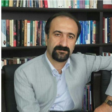
که بهان عهزیزی

ناسنامه‌ی کتیب: «فهلسهفه‌ی کانت»، د. محهمهد کهمال، چاپمه‌نی سه‌رده‌م، ۲۰۱۷.