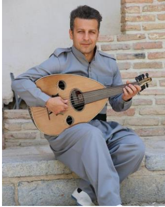
شارام که مانگهر

ناساندنی کتیبی «پیشه کییهک له سهه مه قامه کانی مۆسیقای کوردی»